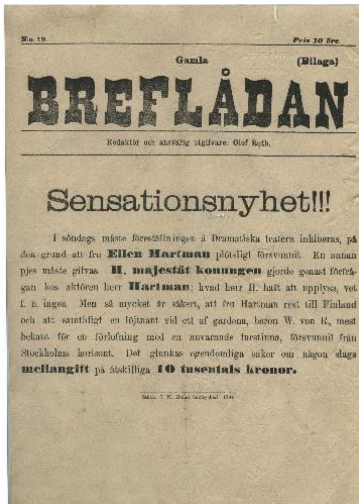
Gamla Brevlådan nr 19, 1891, Sveriges teatermuseum

Mitt i säsongen tvingades Dramatiska teatern ställa in en föreställning. Det berodde inte på sjukdom utan på att den kvinnliga huvudrollsinnehavarskan Ellen Hartman plötsligt var försvunnen. Snart läckte det ut detaljer om en planlagd flykt till Finland med en ung löjtnant och om en märklig överenskommelse med den övergivna maken herr Hartman sades inkludera tio tusentals kronor. Det senare var ett obekräftat rykte, säkert är dock att Ellen Hartman hamnade i Paris där kärleksförbindelsen upplöstes efter ett antal turer. För henne fanns det då ingen väg tillbaka till Dramaten. Hon hade svikit både sina kolleger och sin publik. Känslorna i Stockholm var ännu mycket upprörda gentemot stjärnan alla älskat så.